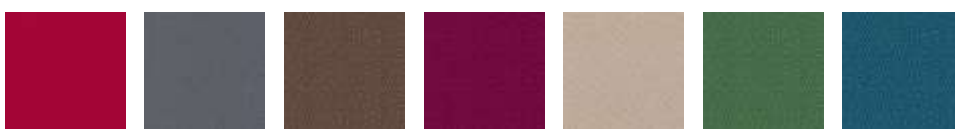
XR079 XR081 XR091 XR101 XR108 XR159 XR160

Skład: 100% poliester pochodzący z recyklingu. Nie zawiera pigmentów metalicznych