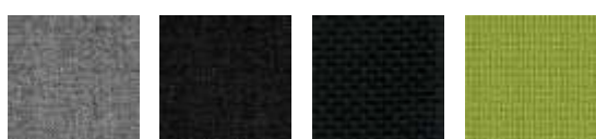
EF031 EF002 EF019 EF046