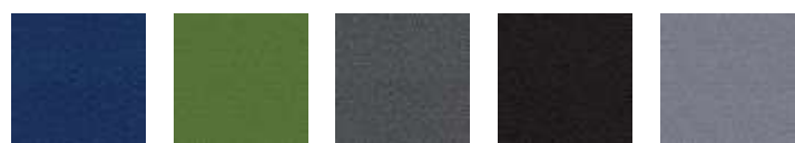
BN6016 BN7048 BN8010 BN8033 BN8078