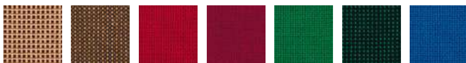
C4 C24 C2 C29 C34 C32 C6