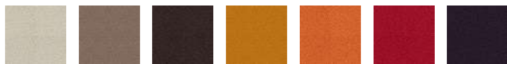
BN1005 BN1008 BN2036 BN3005 BN3012 BN4011 BN5004