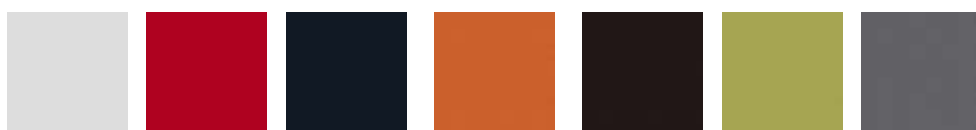
KN03 KN32 KN49 KN143 KN250 KN429 KN484